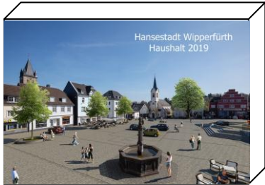
Hansestadt Wipperfurth Haushalt 2019